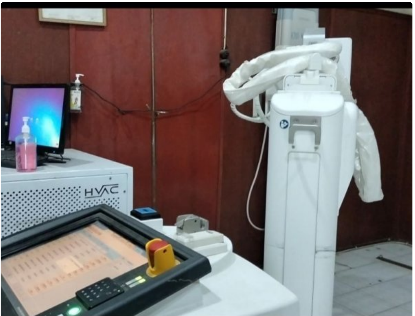
Alat Radiologi Rontgen RSUD Kabanjahe, yang dibiarkan rusak, Rabu (03/01-2024)

KARO - Pelayanan rumah sakit umum daerah (RSUD) milik Pemkab Karo, saat ini semakin 'Carut-marut' tak beraturan dan terkesan terabaikan.